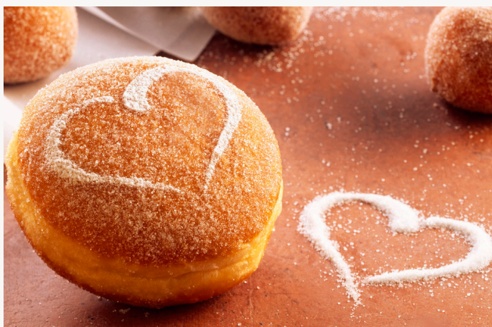
405864, Berliner u/fyld