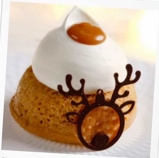
KREATIV TRES LECHES med creme og saltkaramel