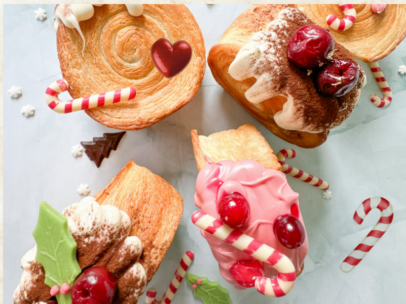
315279, Julestok i hvid chokolade