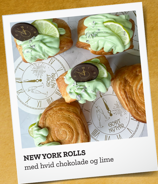
NEW YORK ROLLS med hvid chokolade og lime

Glæd dig til NYTÅRS FOLDEREN 2024 . Fyldt med idéer til nytår og overgangen fra 2024 til 2025. Her finder du blandt andet lækker nytårs pynt, opskrifter på desserten, kransekagen osv. Folderen udkommer i uge 42