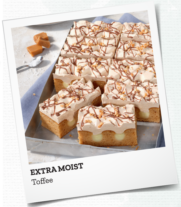
EXTRA MOIST Toffee