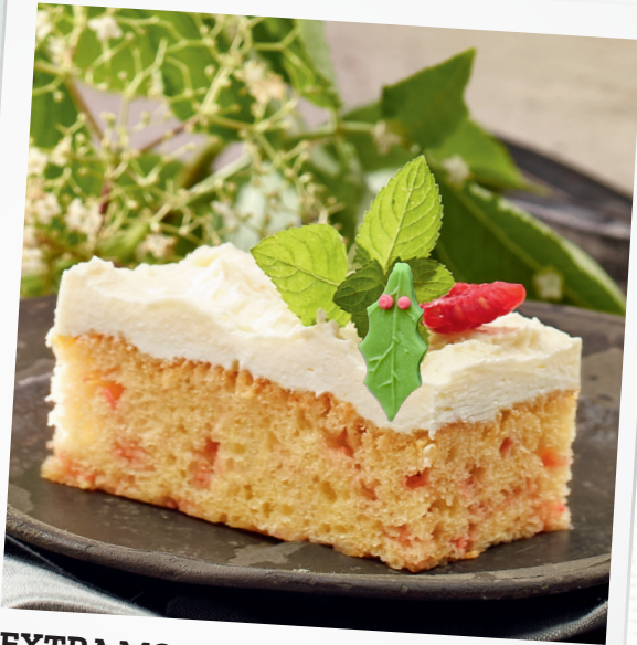
EXTRA MOIST Plain