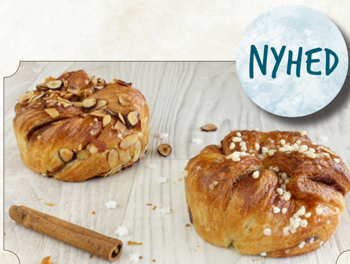
410736, Kanel kringle