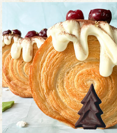
394947, Juletræ i mørk chokolade

Fine juletræer i mørk chokolade, perler i guld eller sølv, hvide sukker snefnug, julestokker i hvid chokolade, kristtjørn i grøn fondant - ja, mulighederne er mange... SE DET HELE HER