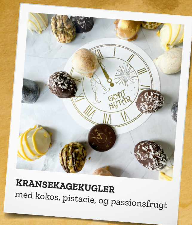
KRANSEKAGEKUGLER med kokos, pistacie, og passionsfrugt

Har du ikke givet dit i kast med New York Rolls endnu, så er det måske til Nytår du skal prøve det. Nytårsvarianten her er med fyld af lime og hvid chokolade. Lækkert og anderledes til årets sidste aften.