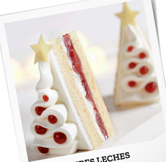
JULETRÆ TRES LECHES med creme og hindbær