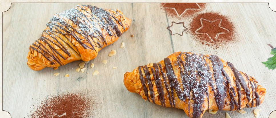
408870, Croissant Royal