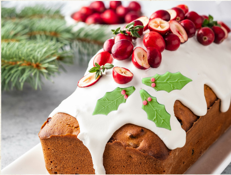
392264, Kristtrjørn i fondant