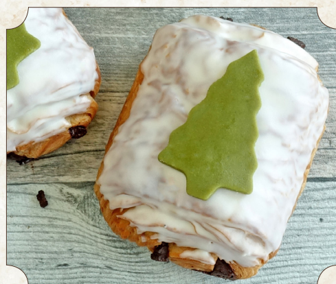
410266, Pain au chocolat