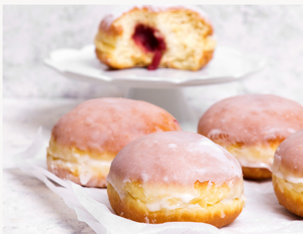
405863, Berliner m hindbær/ribs fyld

Berlinerne kan bestilles uden fyld på varenummer 405864, eller med lækker fyld af hindbær og ribs på varenummer 405863.