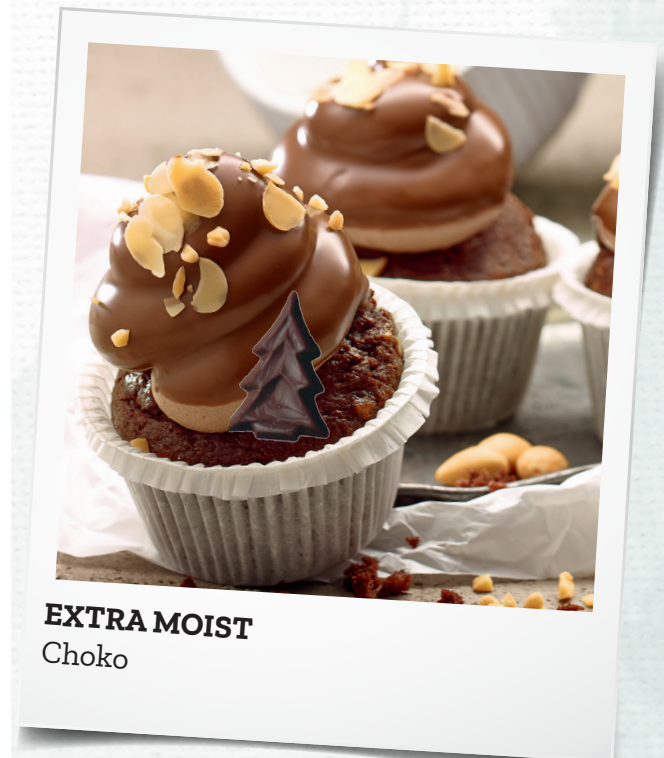
EXTRA MOIST Choko