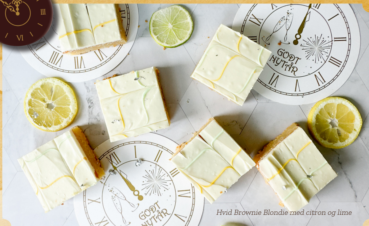
Hvid Brownie Blondie med citron og lime